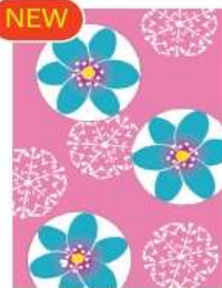
ミスミソウ <はにかみ屋>