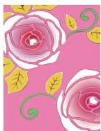
ばら <愛情のプレゼント>