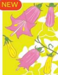
ツリガネニンジン <優しい音色>