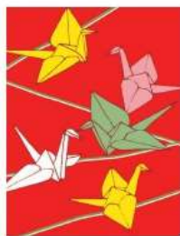
鶴 <夫婦円満の象徴>