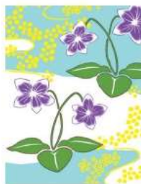
すみれ <誠実・小さな幸せ>