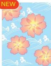
子福桜 <愛は死より強し>