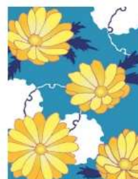
福寿草 <幸せを招く>

ネットでのご購入はこちらから： https://store.shopping.yahoo.co.jp/kanou-web/